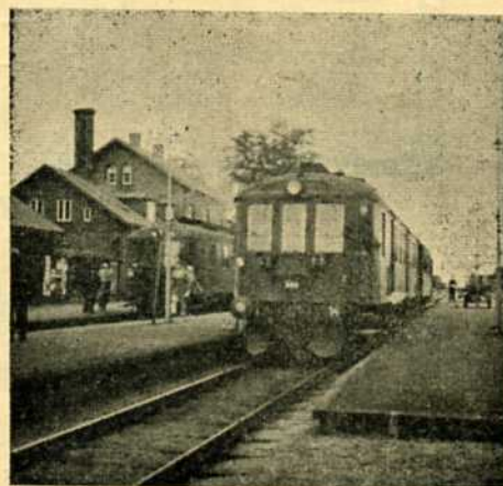
Ålestrup st. — Sidste gang ekspeditionen af planpersontog til alle 3 sider