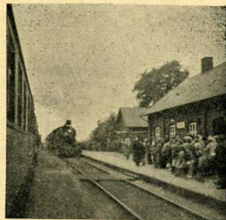
I Skals blev den sidste aften yderligere historisk derved, at der var etableret ekstraordinær krydsning