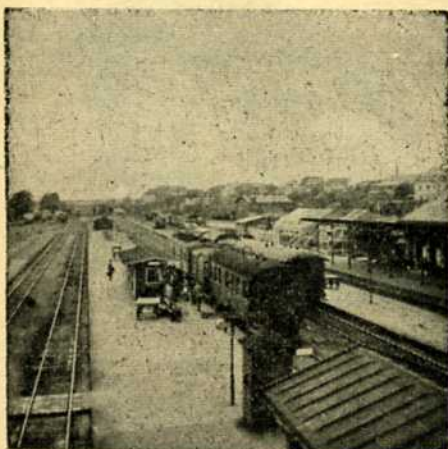
Forrest holder på Viborg st. sidste persontog til Ålestrup