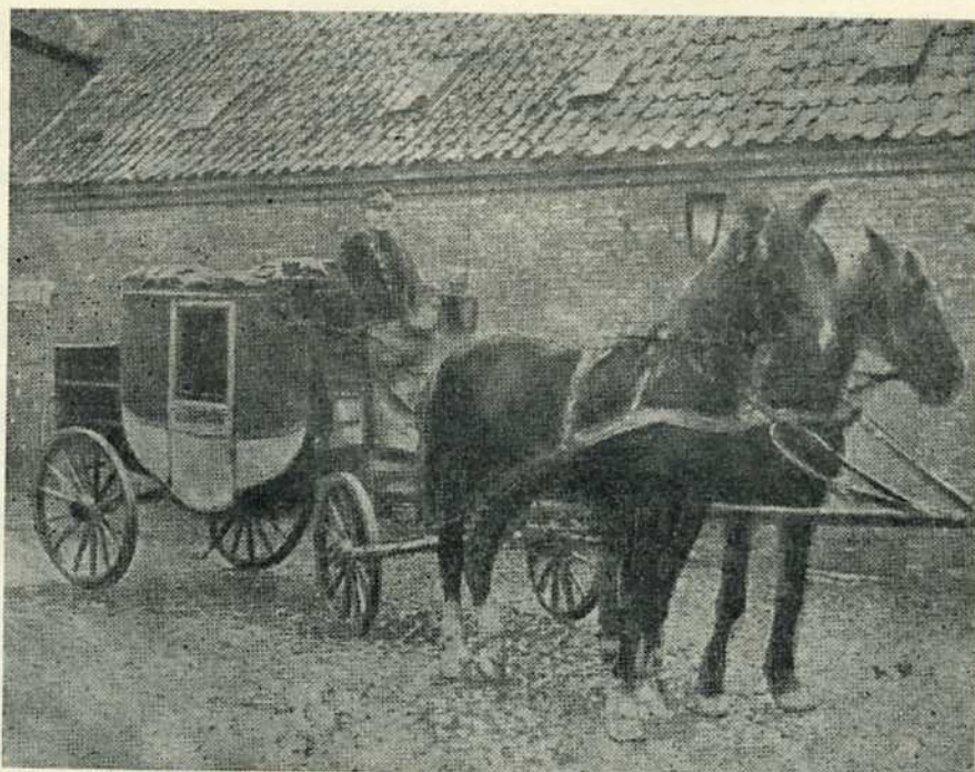
Diligencen Fjerritslev-Thisted med post-Søren på bukken

Gennem århundreder var Nordjylland egnen Norden for lov og ret. Alfarvejen snoede sig gennem øde egne og knyttede de spredte byer og bebyggelser sammen med et spinkelt bånd. En så afsides provins som Nordjylland måtte for færdselsvejenes vedkommende blive et stedbarn, og ustandselig klagedes der da også over vejenes slette tilstand. De hjalp lidt, da vejen op gennem Hanherred omkring 1850 blev chauseret, men helt fin har den næppe været, for saa sent som 1890 kunne man i Aalborg