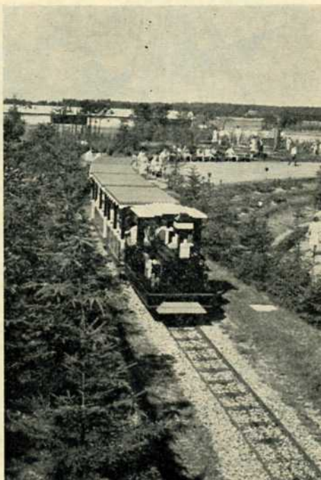
LEGO banen, Billund.

Til sporanlægget hører krydsningsspor på »stationen« samt en 2-sporet remise.