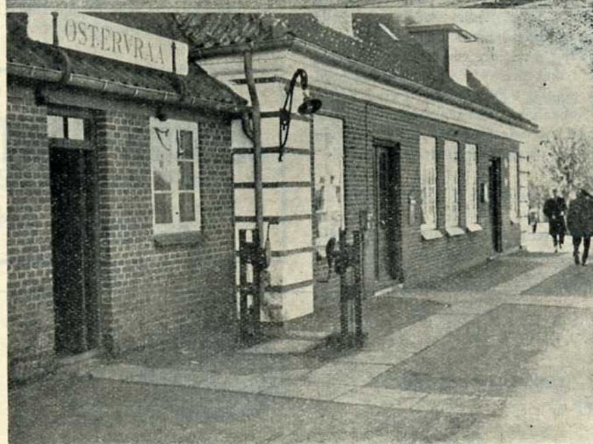
Øverst: Hørby station