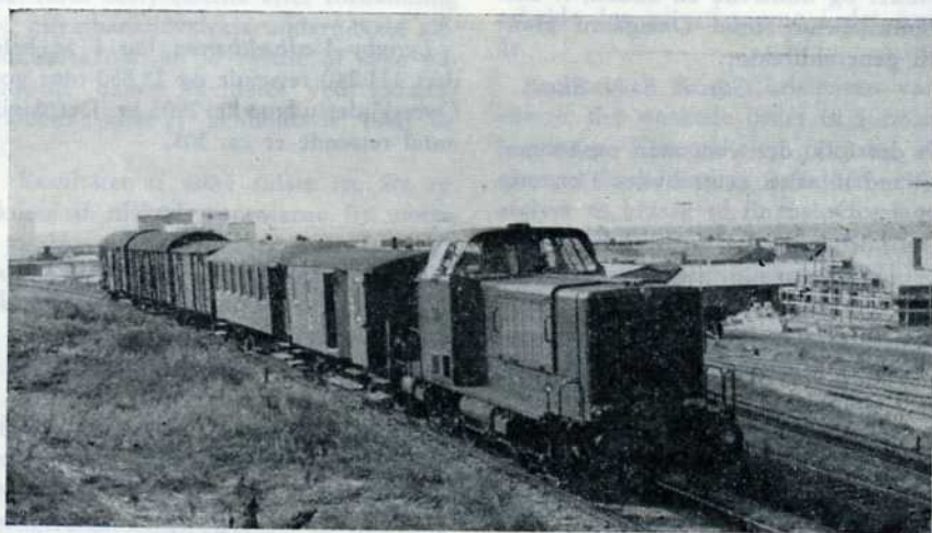
MaK-loko med godstog til Hjørring. — I baggrunden fabrikker og havnen i Hirtshals.

verse fine gearskiftninger og hurtige igangsætninger, samt studeret det barske men samtidig smukke landskab, er man på vej ind til Hirtshals station. Man bliver overrasket over alle de spor, man ser. De går både op og ned, og en masse godsvogne står på dem. Nå, det er heller ikke nogen helt almindelig privatbane, og Hirtshals er heller ikke nogen helt almindelig by. Man lander ved stationsbygningen, der ligger højt hævet over havnen. Det er ikke byens første stationsbygning, for byen er i rivende udvikling og har krævet stationsflytning een gang. Hvis der ligger en færge eller et skib i havnen til Norge, så kører motorvognen igen ud fra stationen og ruller kort efter ned ad bakken til havnen, hvor man har bygget en fin ny station i forbindelse med færgerne. Her er noget at se på. Foruden færgerne til Norge, hvoraf den ene kan medføre jernbanevogne, ligger der en masse store fiskekuttere. Ikke den slags små både, der holder til i Kerteminde og tilsvarende steder, nej, det er store stålkuttere, der virkelig fylder noget. Der losses fisk og fyldes is og hejses og gøres ved, så det er en ren fornøjelse. Der står en masse godsvogne på kajerne og på sporene, Vogne, der venter på overfart til Norge, og vogne, der er kommet fra Norge og skal videre sydpå. Der står blandt andet vogne fra Norsk Hydro, der er kendt for fremstilling af tungt vand. Det er dog