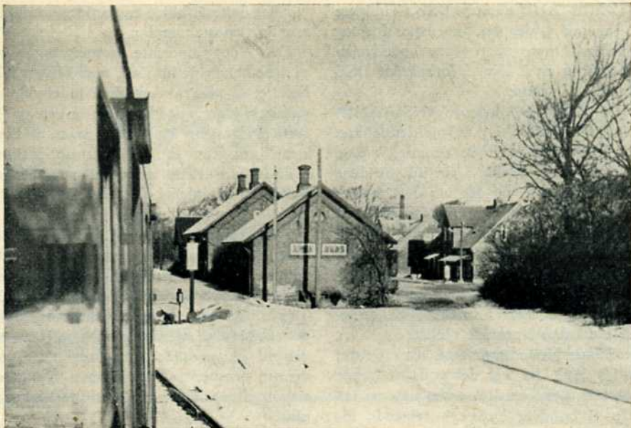
Vindblæs st. fra syd

Års: Stor by, stor godsudveksling, men også tiden afsat dertil. Minus en rejsende, men også plus en do., altså status quo ante. I Års er der også tid til at kaste et blik på niveauskæringen i stationens nord-