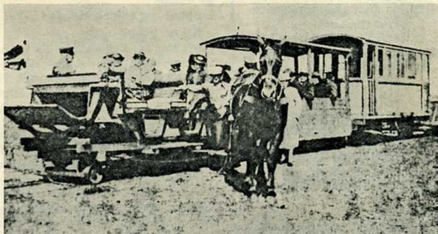
Lakolk-banens materiel + 1 hestes kraft.

Vi har haft den glæde at modtage supplerende oplysninger til artiklen om Lakolk-Kongsmark banen på Rømø i vort decembernummer, 1970.